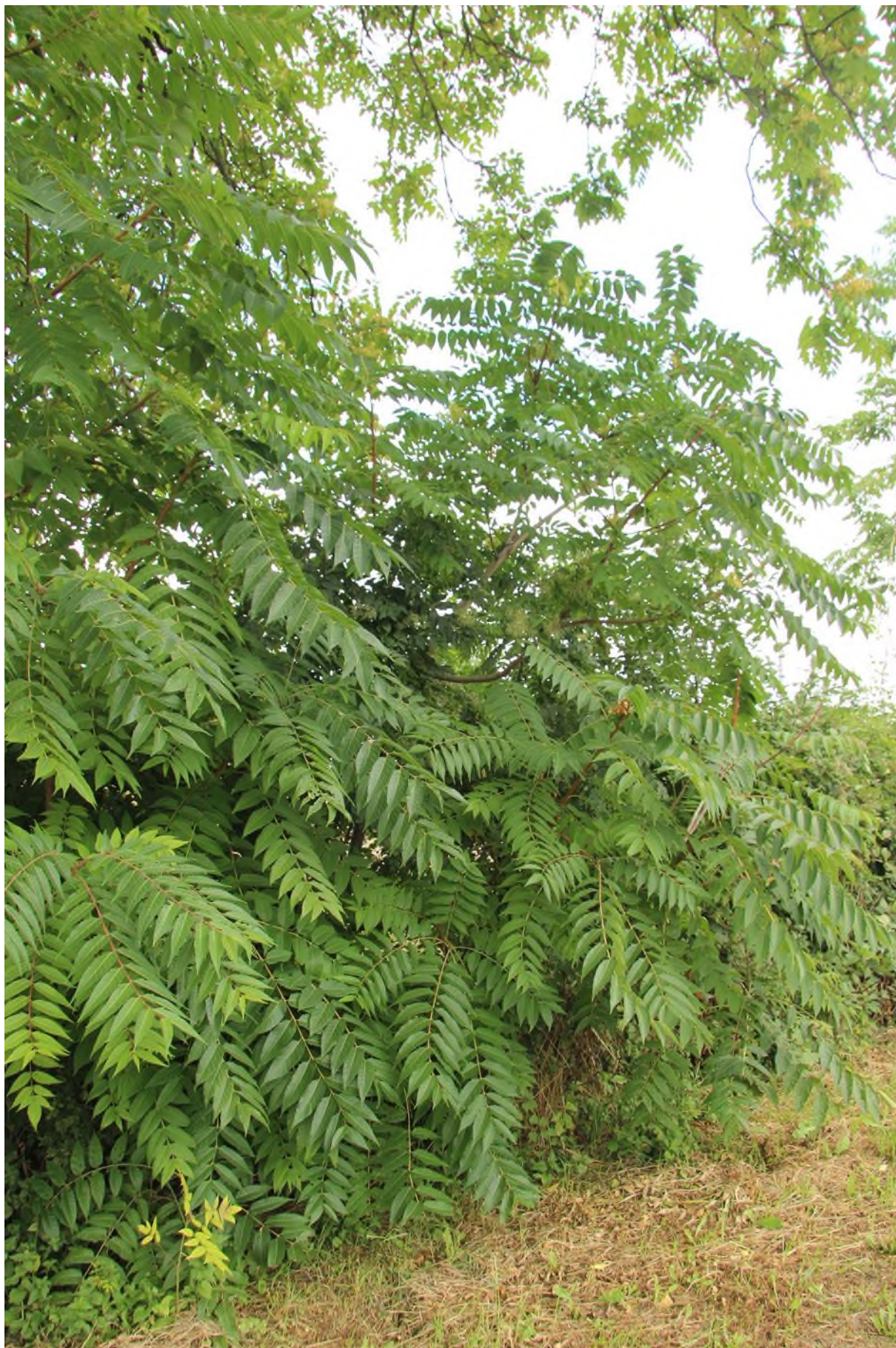
liniový porost pajasanu podél plotu, vzhledem k vysokému počtu semenáčků a výhonů se jedná o hustý porost