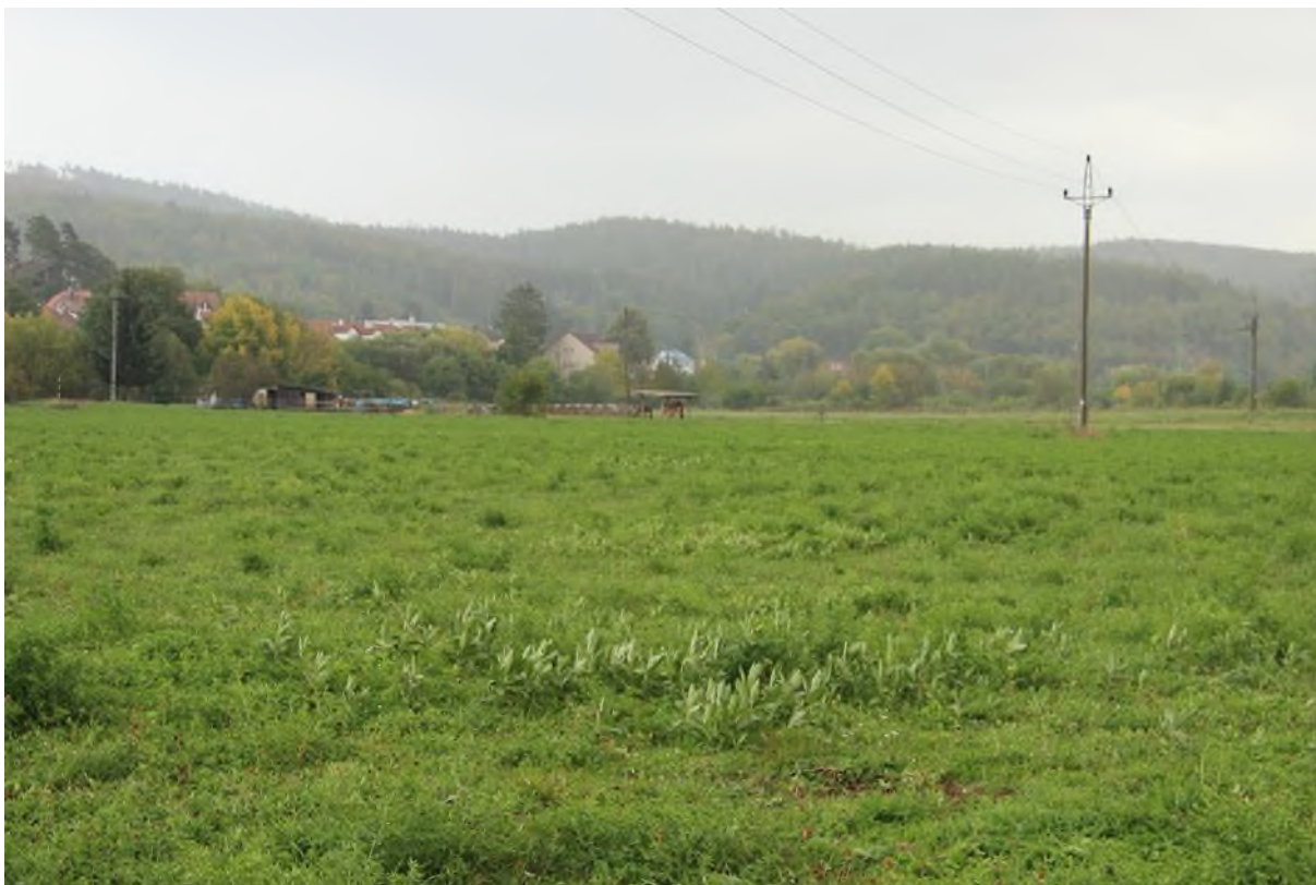
hustá pokrývnost na pastvině