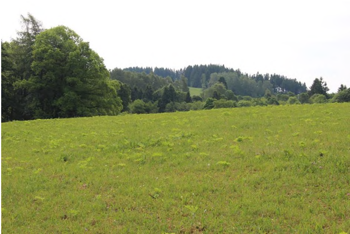
pokud na ploše nejsou ve velké míře semenáče, jedná se o střední pokryvnost