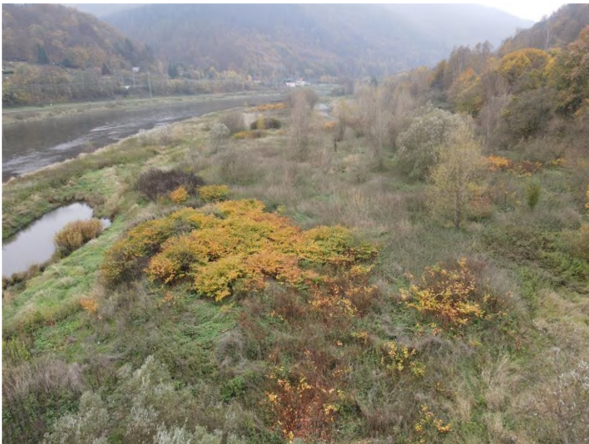
křídlatka viditelná jako rezavé porosty. v tomto případě se jedná o kombinaci střední a husté abundance. pro zřetelnost zakres v kopii obrázku (zákres jen polykormonů v popředí)