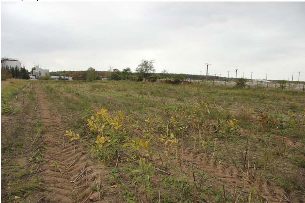
chybějící listy mohou značně ovlivnit vnímání hustoty porostu. zde se jedná o hustou pokryvnost