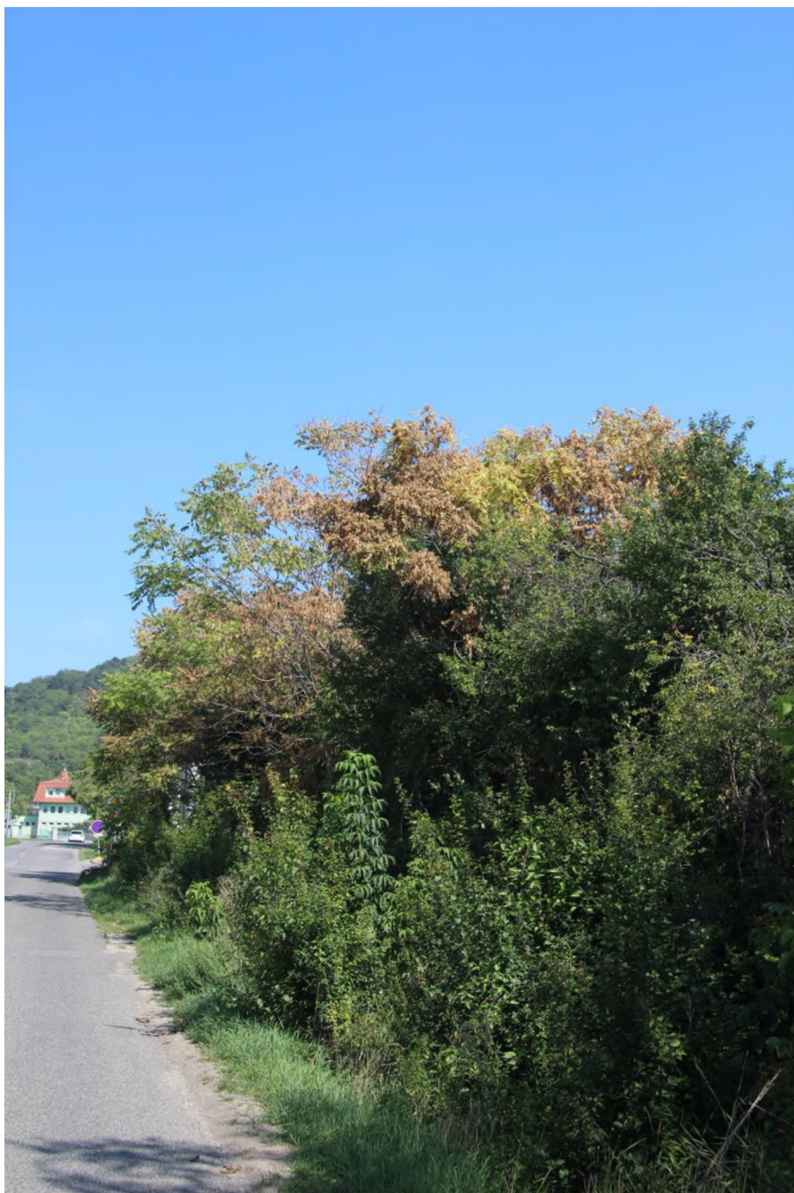
Viditelné odumírání dospělého stromu pajasanu po navrtání a aplikaci herbicidu.