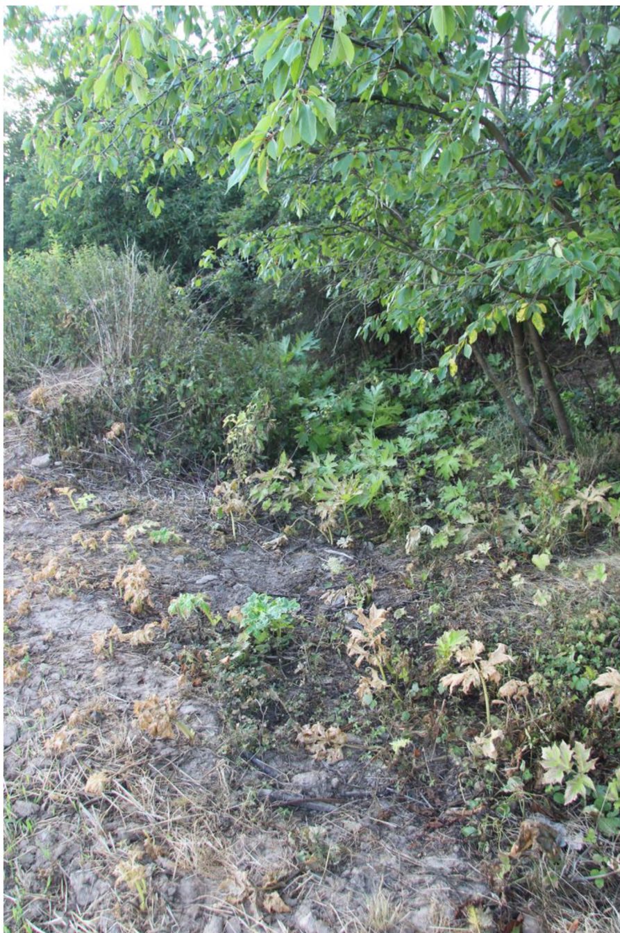
Postřikem nedostatečně ošetřená plocha s bolševníkem.