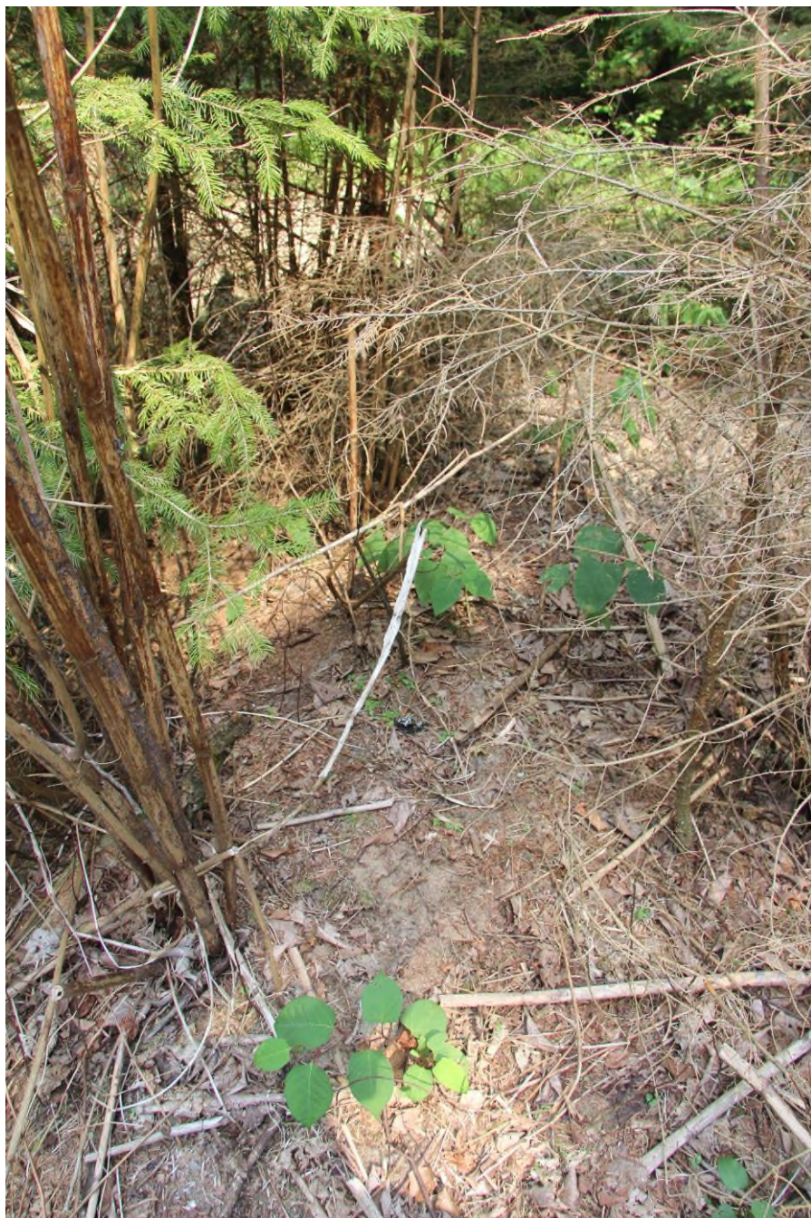
V ploše ošetřené herbicidem dochází k i přes správný postup k regeneraci. Regenerující výhonky je třeba ošetřit.