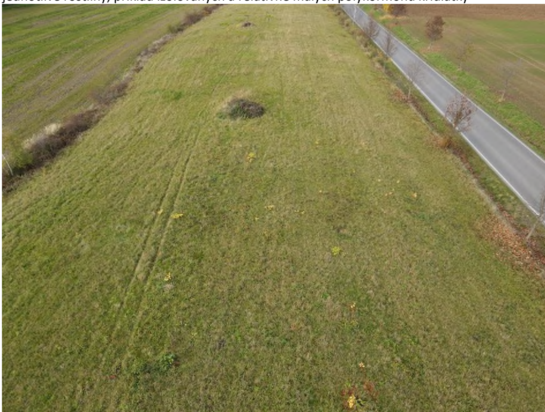
křídlatka rozetá na louce. nemá smysl zakreslovat jednotlivé výhony (ramety). příklad střední hustoty