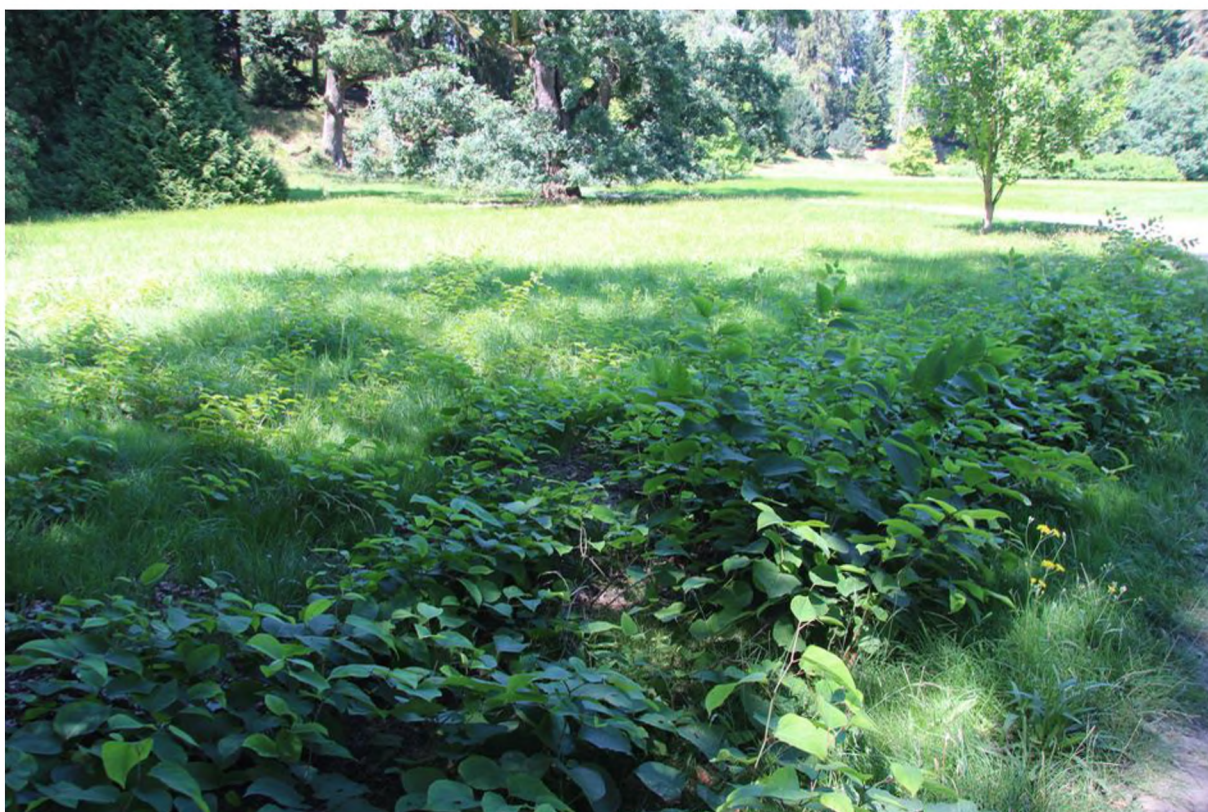
příklady hustých porostů. sekání značně ovlivňuje subjektivní vnímání hustoty