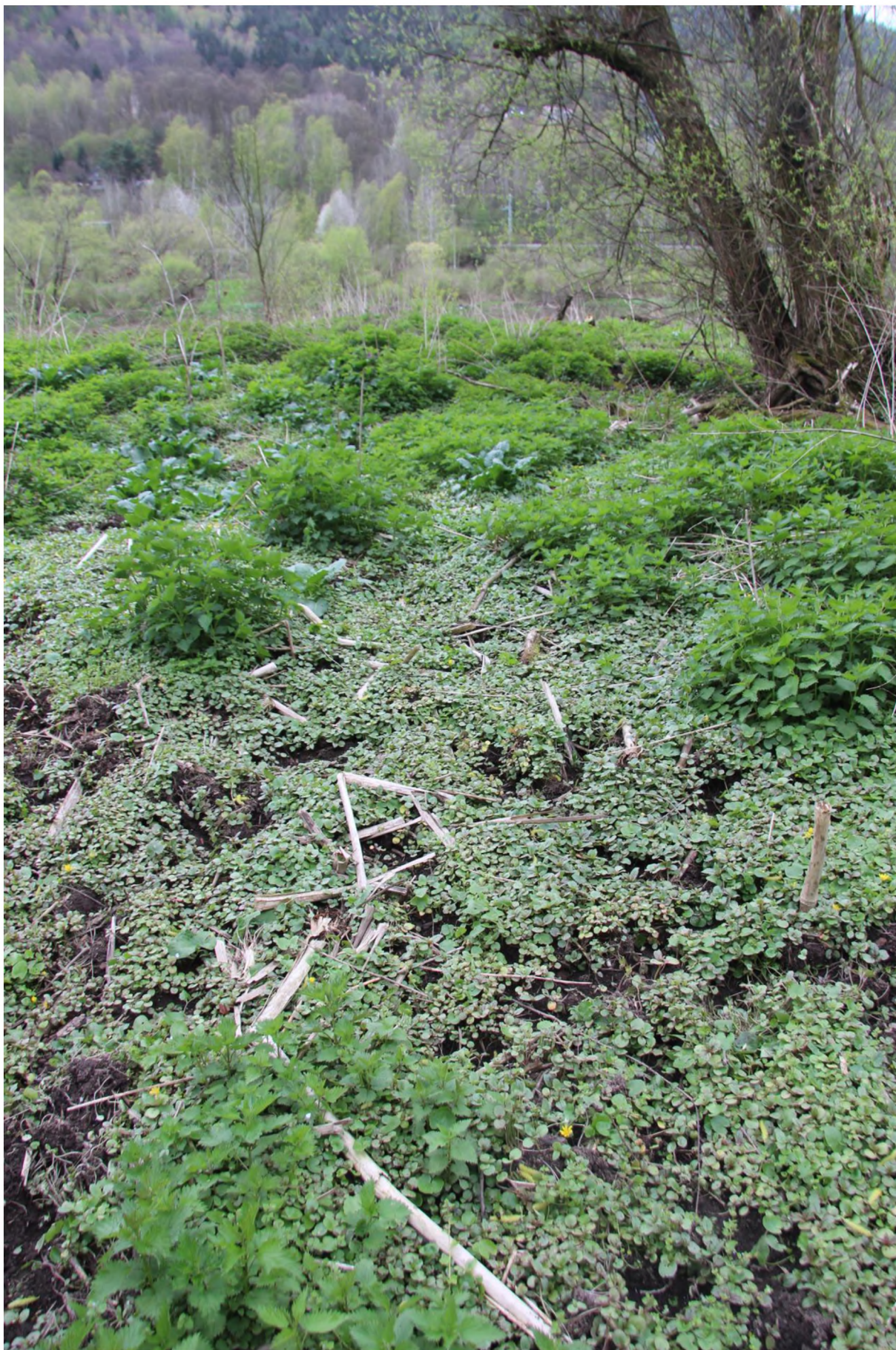
hustý porost (semenáče netýkavky)