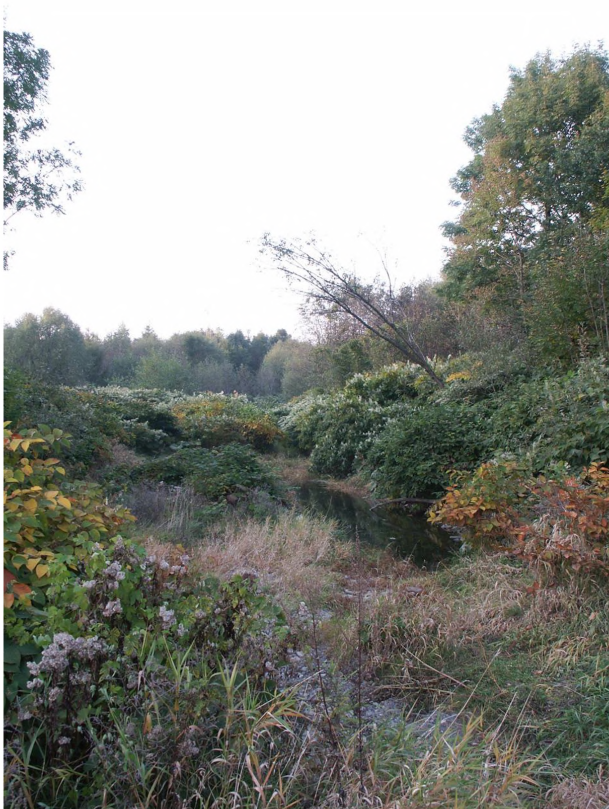
polykormony křídlatky s hustou abundancí