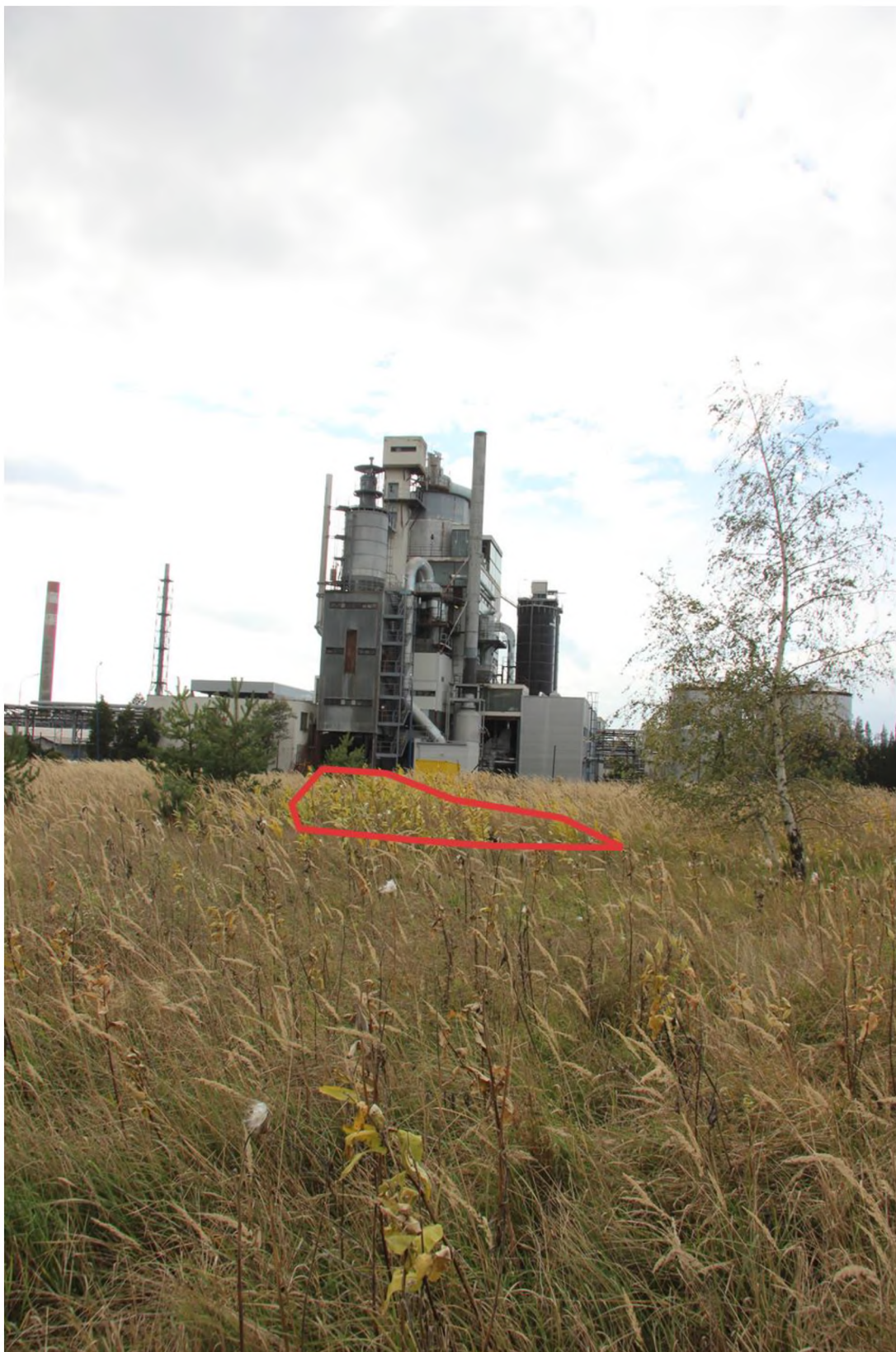
porost s kombinací střední a husté (červeně označené)