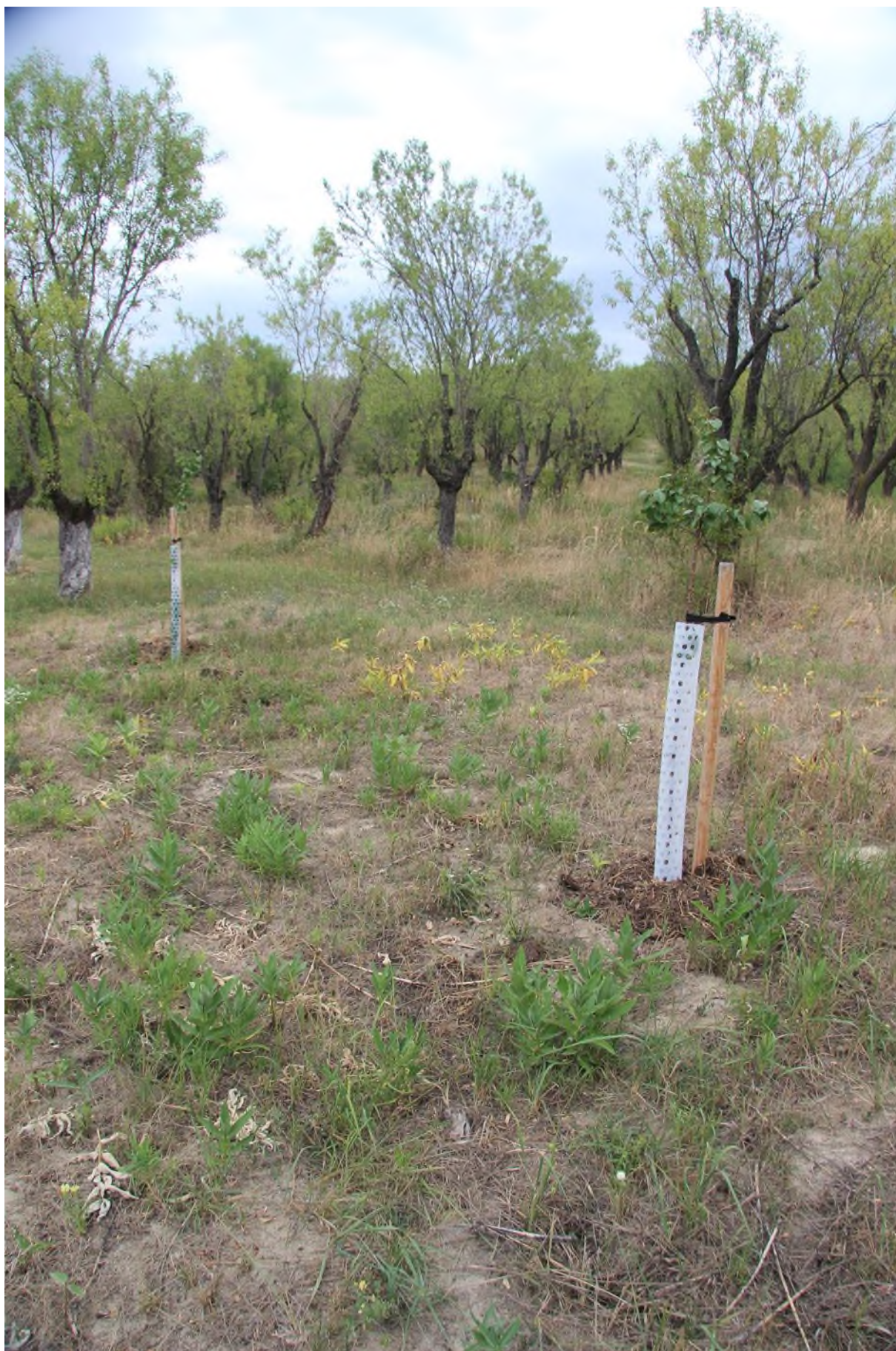
plocha po ošetření. střední hustota