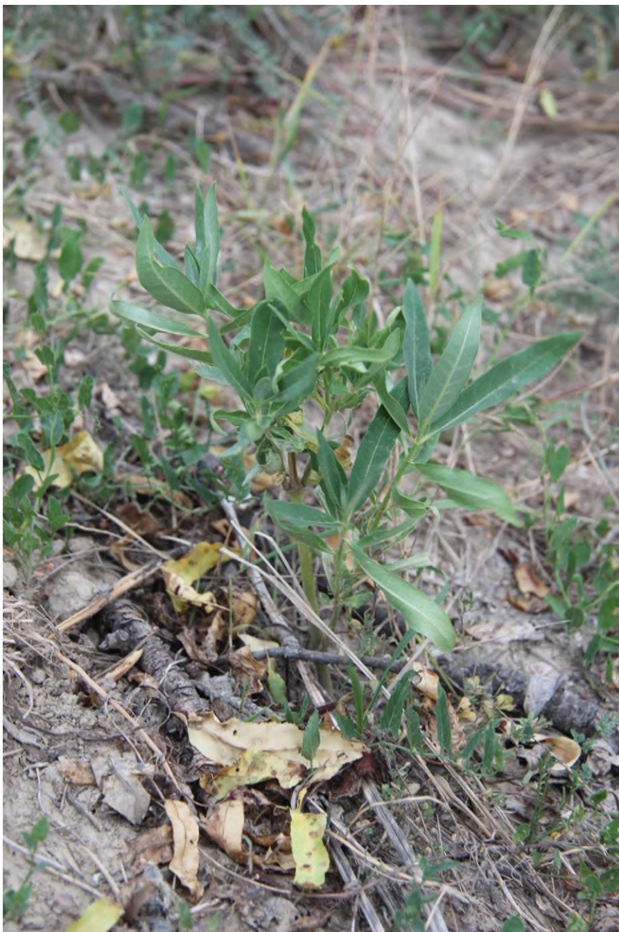
Regenerující jedinec klejichy po ošetření herbicidem. Ošetření je nutné opakovat a používat takové ředění herbicidu, které zlikviduje i pozemní kořenový/oddenkový systém.