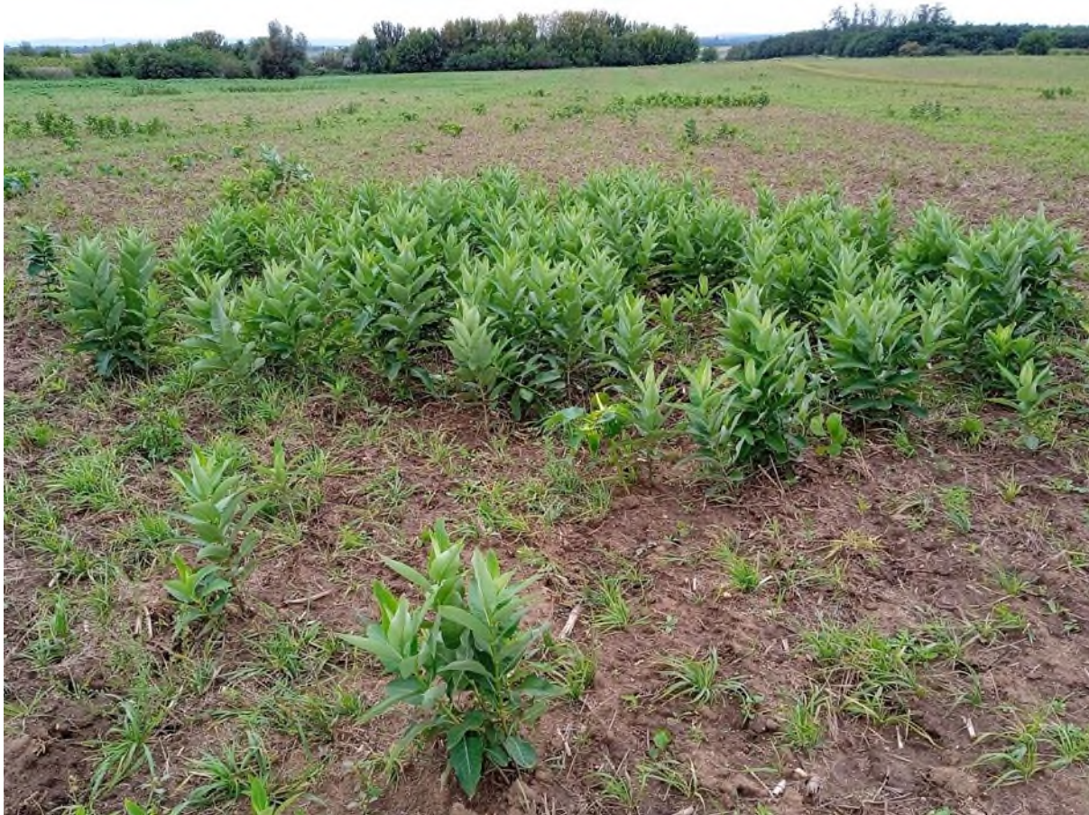
kombinace hustých porostů a střední pokrývnosti na poli