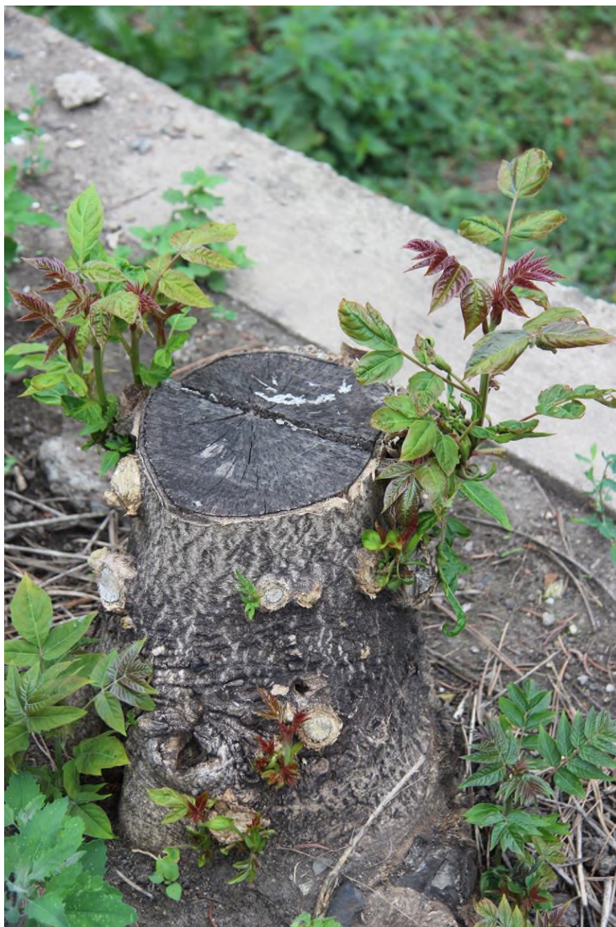
Nedostatečně ošetřený pařez pajasanu s regenerací na pařezu a kořenech.