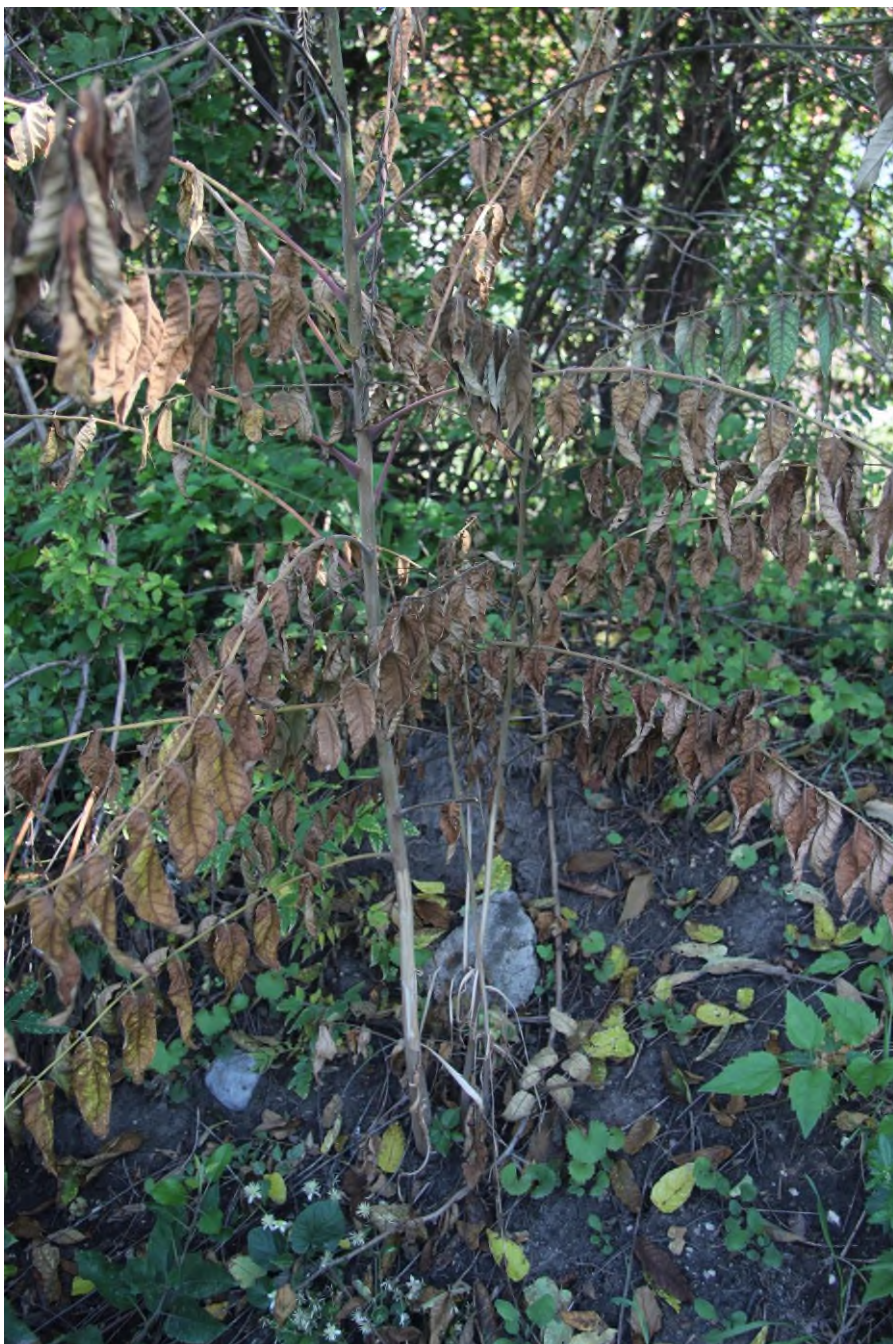
Detail ošetření mladých jedinců pajasanu s odstraněním části kůry a zatřením herbicidem.