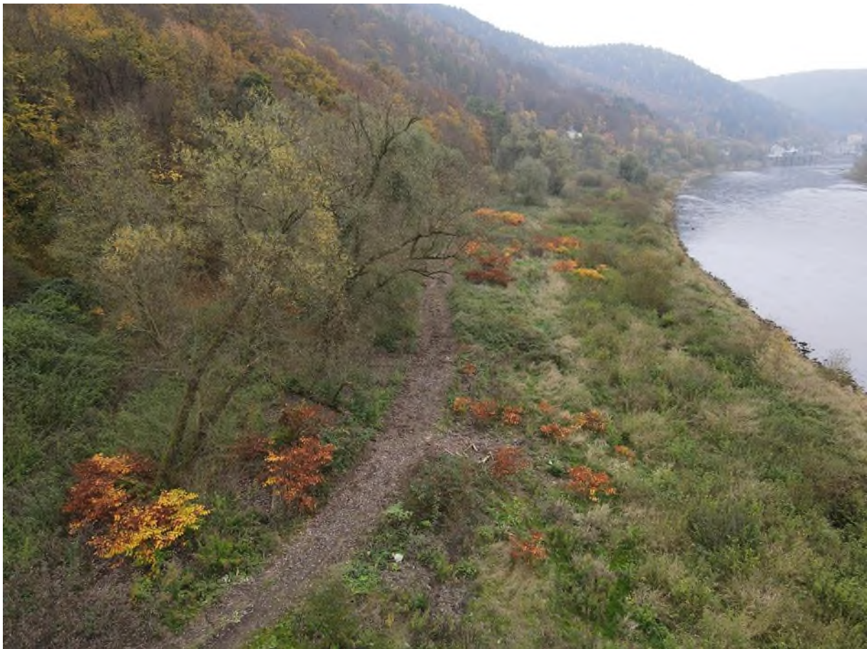
křídlatka viditelná jako rezavé porosty. v tomto případě se jedná o kombinaci střední a husté abundance. pro zřetelnost zákres v kopii obrázku (zákres jen polykormonů v popředí)