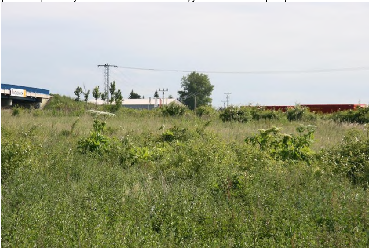
příklad střední pokryvnosti