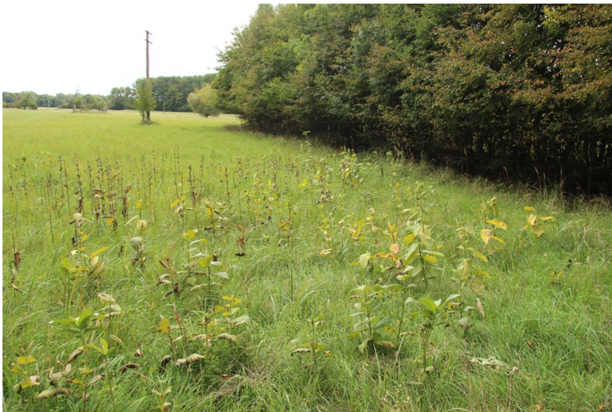
střední hustota klejichy