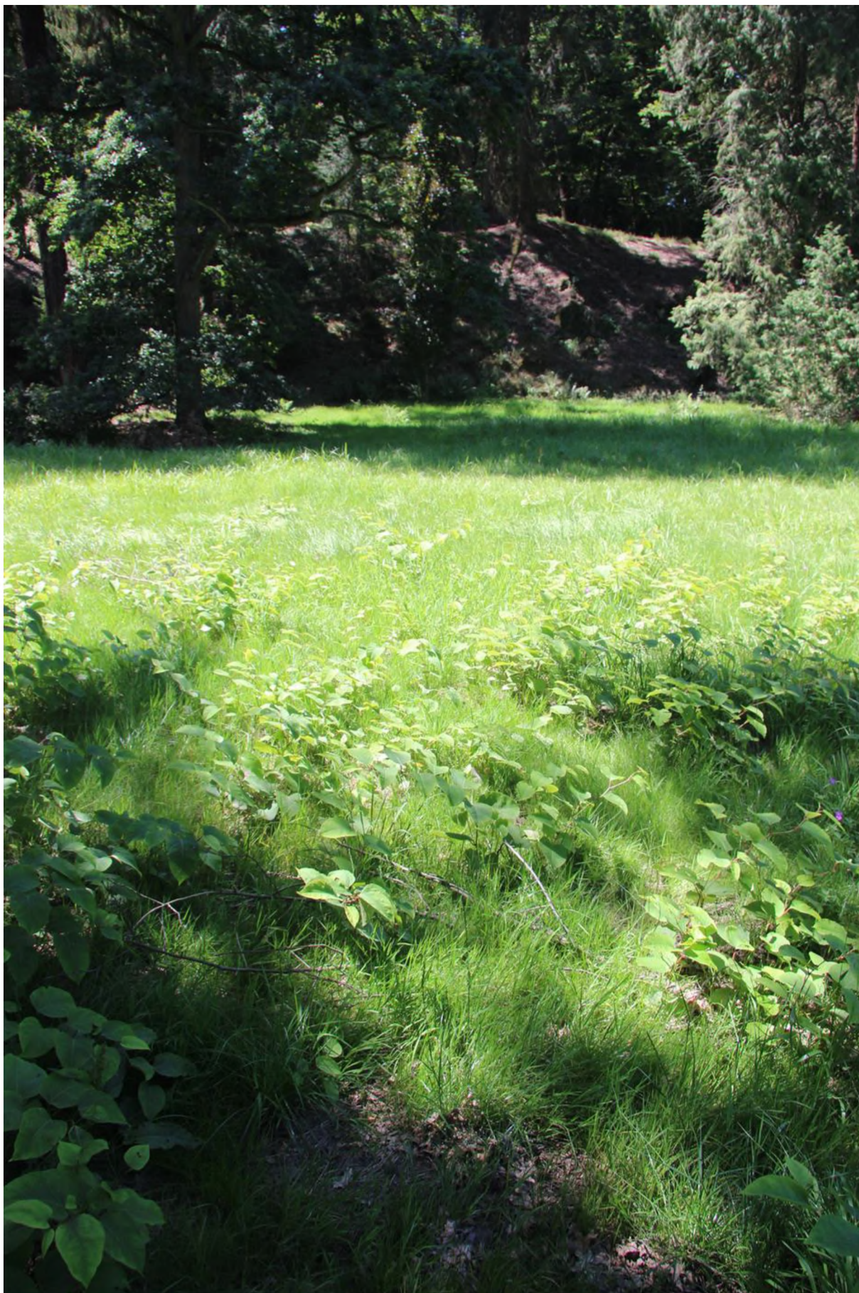
sekání značně ovlivňuje vnímání hustoty. zde se jedná o hustý porost