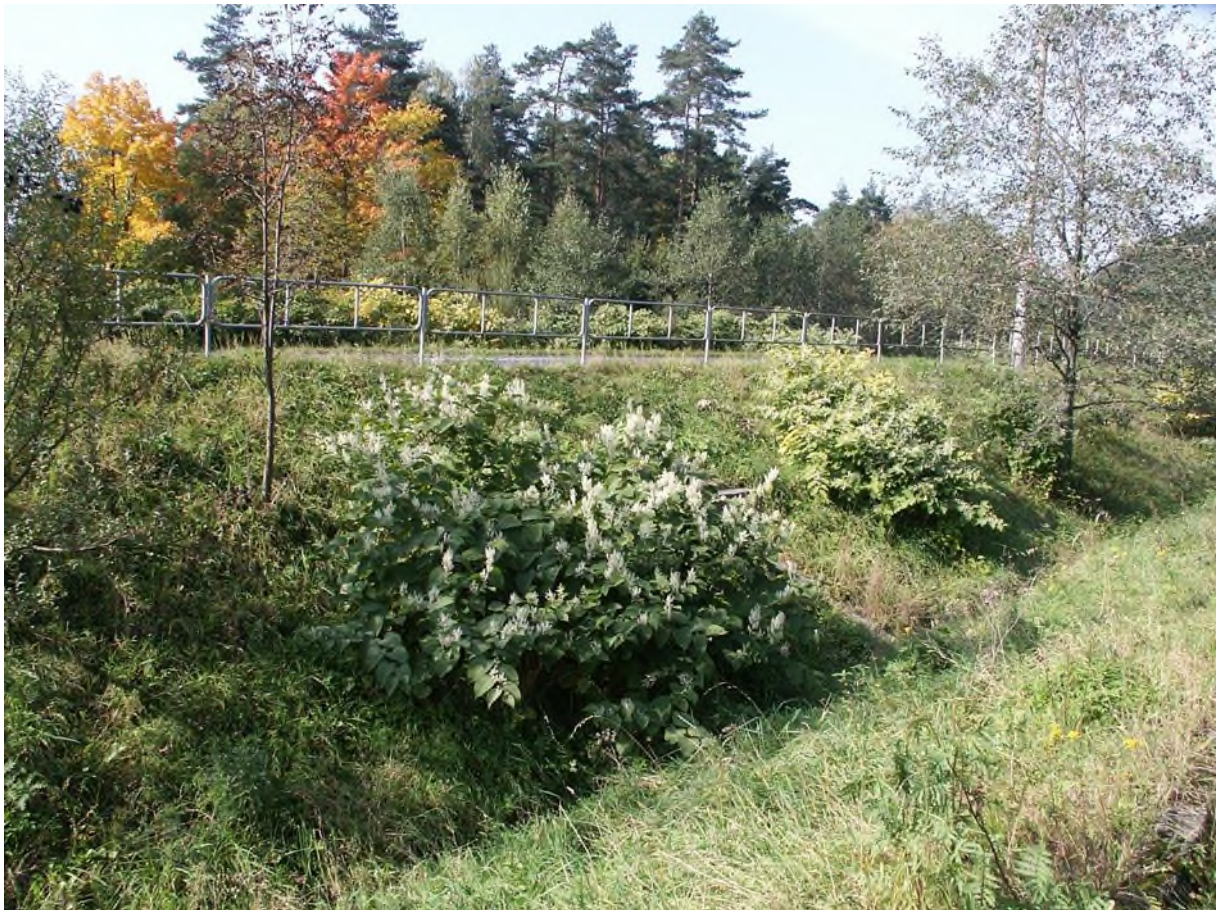
jednotlivé rostliny, příklad izolovaných a relativně malých polykormonů křídlatky