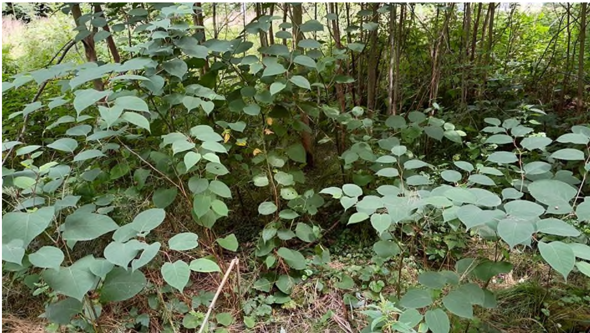
pohled do podrostu husté abundance