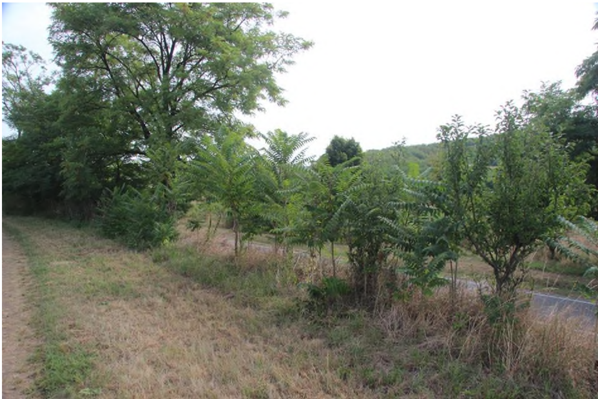
liniový porost pajasanu, střední hustota