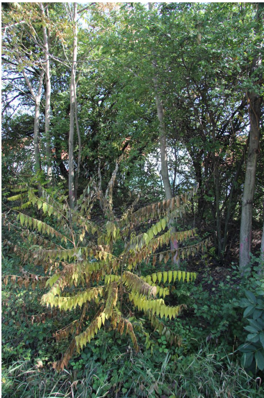
Ošetřený mladý jedinec pajasanu. Je vidět že dochází k odumření.