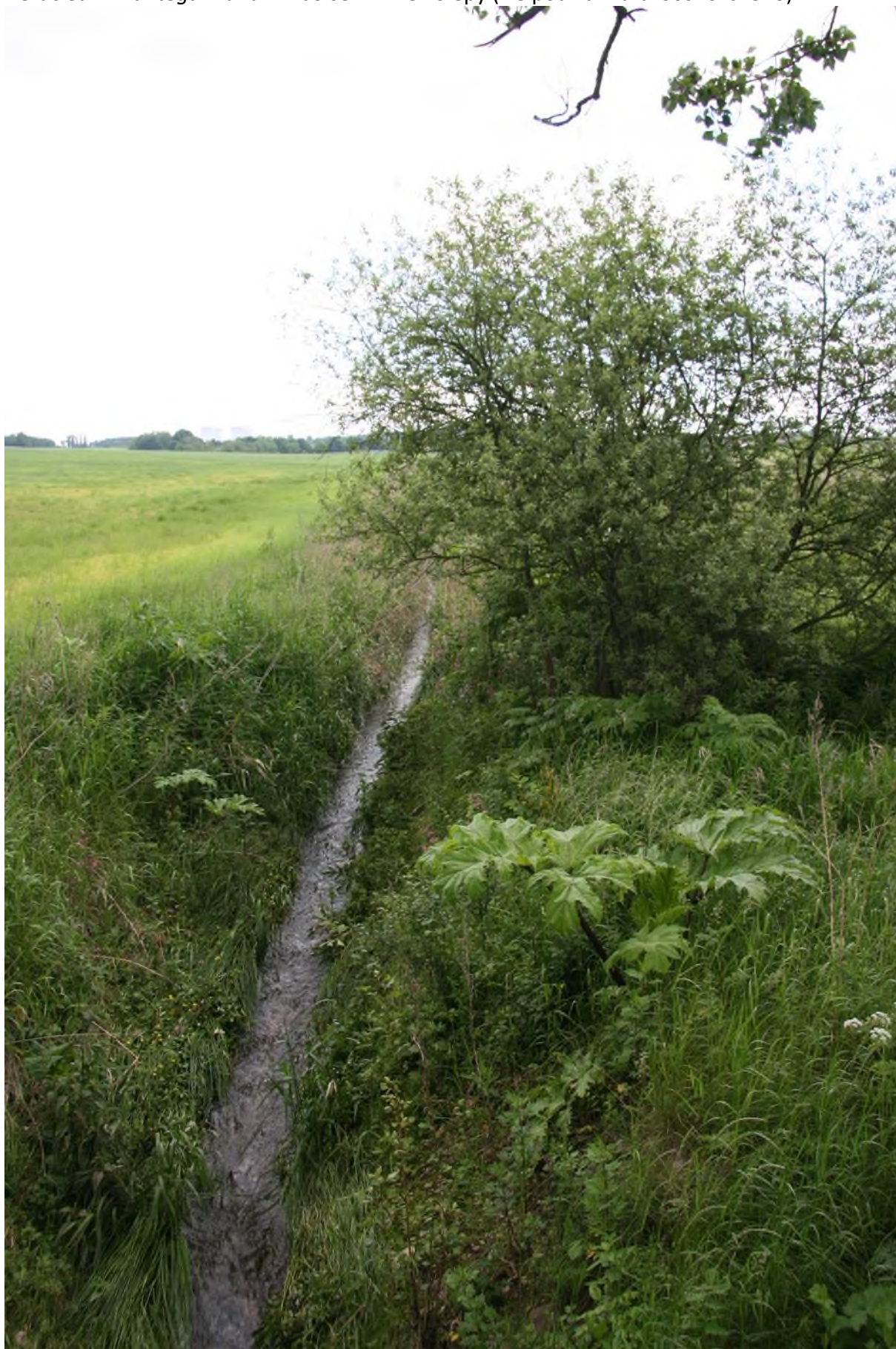
jednotlivé rostliny bolševníku

Heracleum mantegazzianum - bolševník velkolepý (lze použít i na b. Sosnovského)