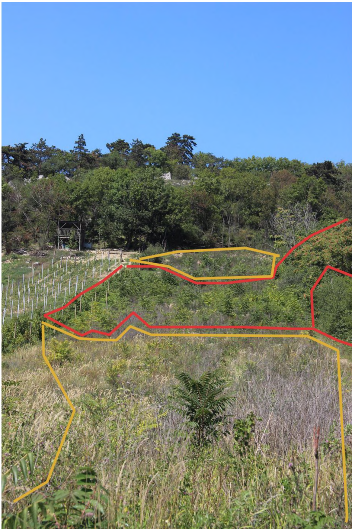
hustý porost ve střední části pozemku, v pozadí a v popředí středně hustý porost