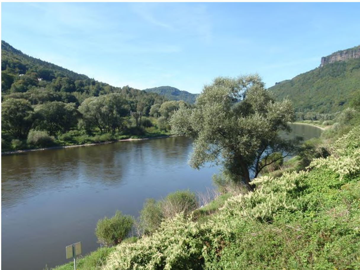
polykormony křídlatky s hustou abundancí