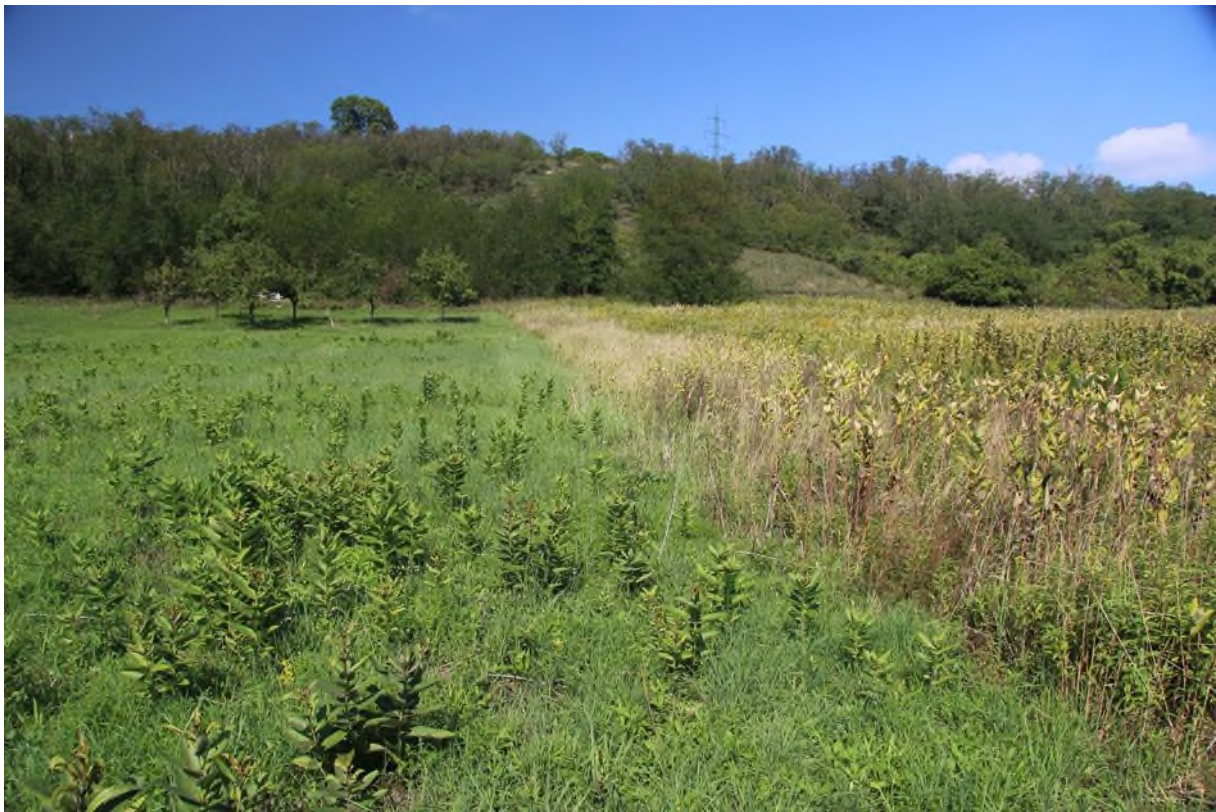
v levé části střední hustota, v pravé části hustý porost klejichy