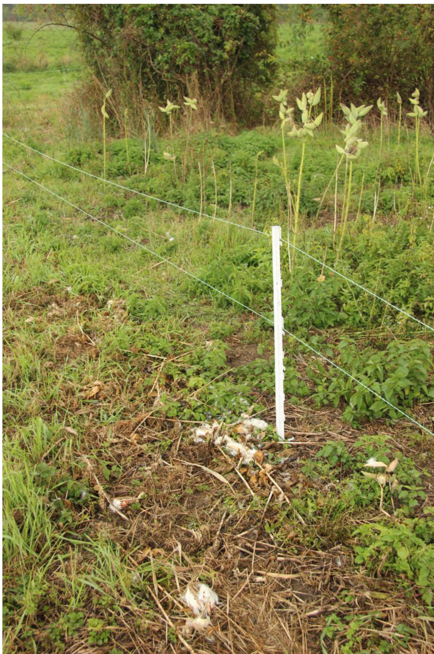
Pozdní zásah proti klejiše s již vyvinutými semeny.