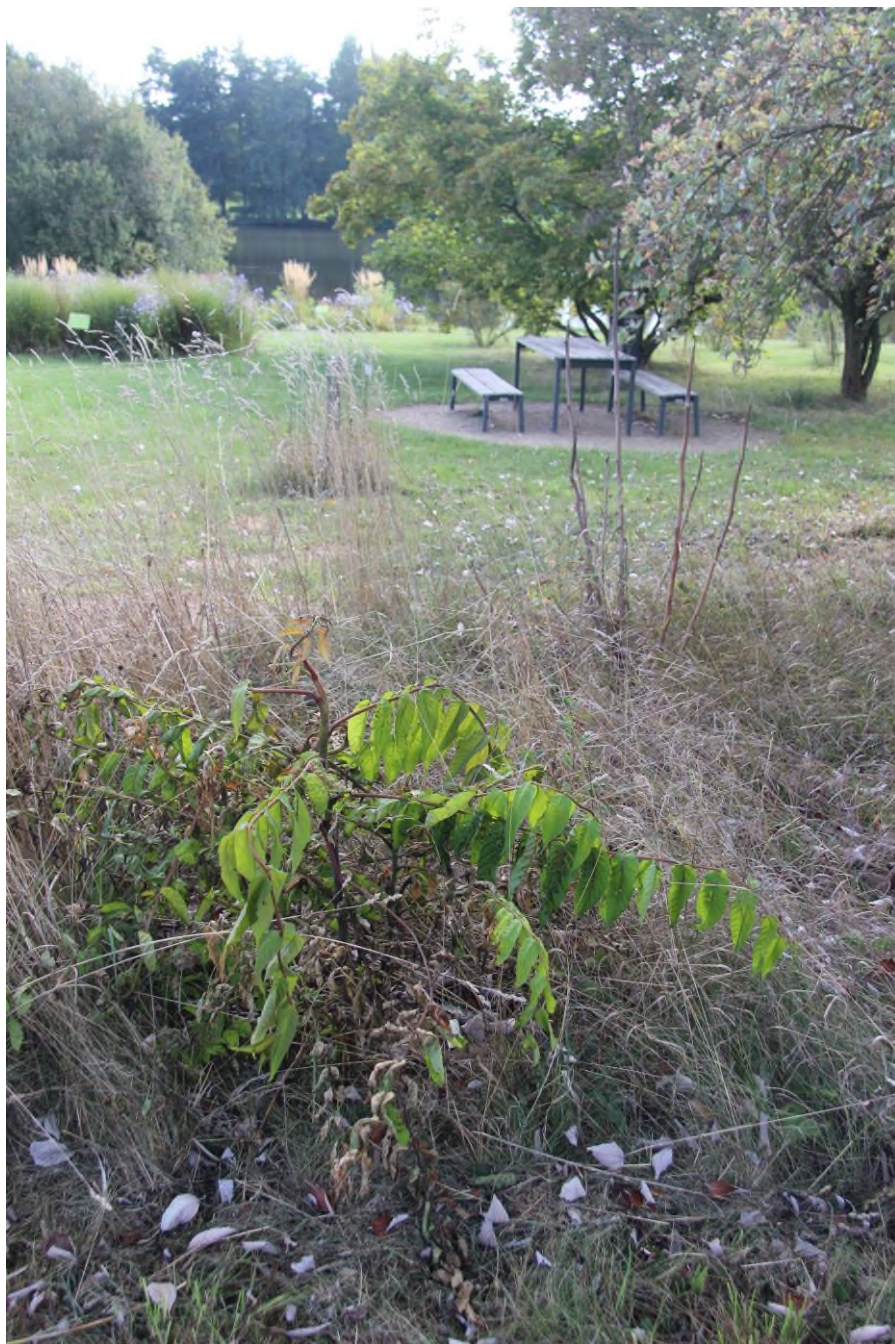
Ošetřený mladý jedinec postřikem. Jedná se o přístup možný, ale s riziky na okolí. Také účinnost nemusí být tak efektivní.