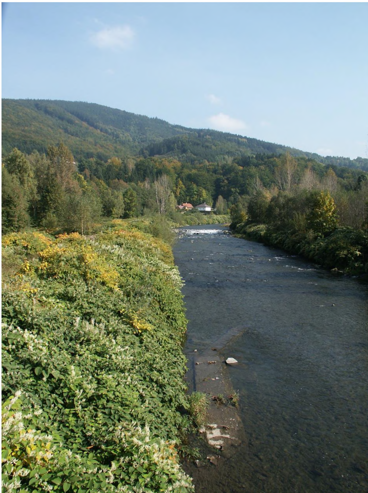
příklad velmi hustého porostu