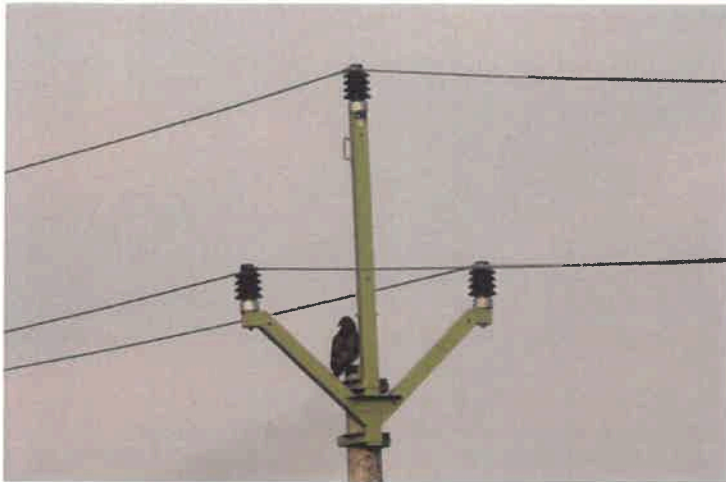
Obr. 3: U původního typu upevnění konzoly měli ptáci možnost dosedat na hlavu sloupu. U nového typu tato možnost odpadá