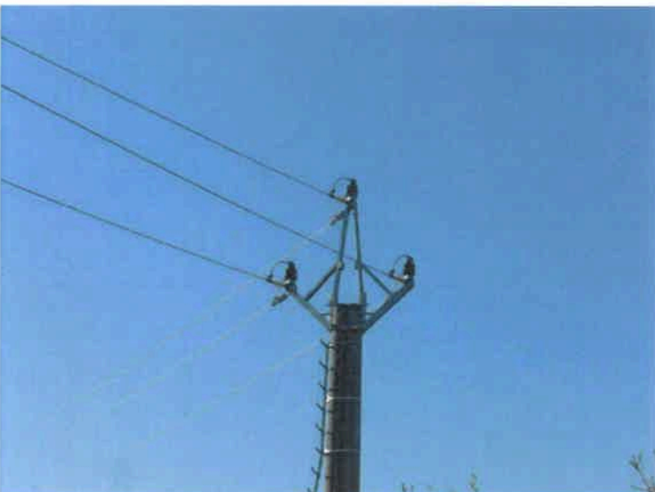
Obr. 5 : Sloup s výstuhami, na kterém došlo k usmrcení sokola stěhovavého (duben 2010, Znojensko)