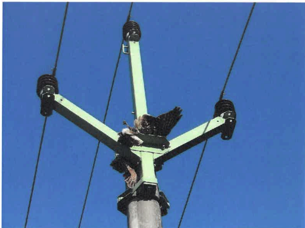
Obr. 1: Káně lesní usmrcená na konzole typu Pařát (okr. Havlíčkův Brod, 2008)