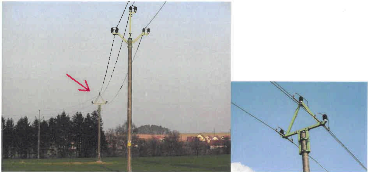
Obr. 6, 7: Trojúhelníková konzola by mohla být pro ptáky bezpečnou variantou k typům s výztuhami (PAŘÁT II-DB-28R-225-250 a PAŘÁT II-DB-28K-225-250) nebo k použití kotevních přípravků JB a DB (Havlíčkovobrodsko)