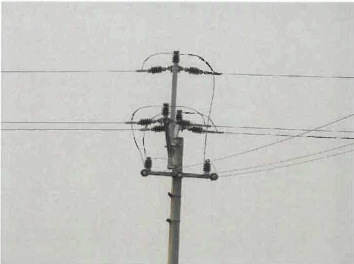
Obr.4 : Odbočovací sloup, na kterém došlo v dubnu 2007 k usmrcení sokola stěhovavého (Severní Morava)