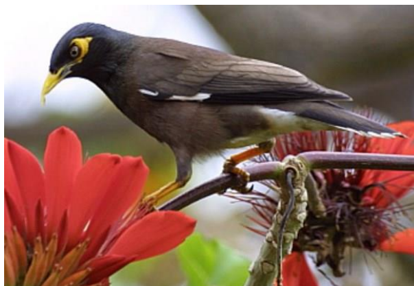
Obr. 1 Majna obecná.

Původ: Oblast od východního pobřeží Kaspického moře, přes Indický subkontinent a jižní podúří Himáláje až po kontinentální jihovýchodní Asii (Thajsko, Vietnam).