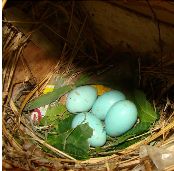
Obr. 4 Typické zbarvení vajíček

Monogamní, žijí v páru po celý život. Hnízdění individuální, nejčastěji v dutinách stromů či skalních štěrbinách, ve městech si nachází rozličné úkryty v okapech, větracích otvorech, na pouličních lampách či nepoužívaných strojích. Snáší 4 – 5 světlě modrých vajec, na hnízdě se střídají oba rodiče, mláďata se líhnou po 13 až 18 dnech.