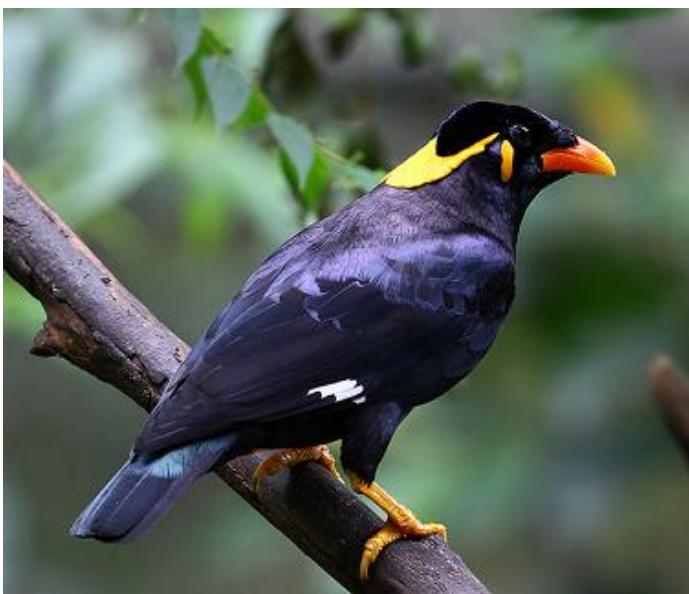
Obr. 6 Loskuták posvátný

Riziko: IUCN zařadila majnu mezi 100 nejhorších invazních druhů. Početné populace v blízkosti člověka jsou nepříjemně hlučné, znečišťují okolí trusem. V agrárních oblastech mohou obdobně jako příbuzní špačci působit škodu na plodinách (víno, arašídy, obilniny). Pro autochtonní ornitofaunu představují potravní a hnízdní konkurenci – jsou dosti agresivní vůči ostatním druhům. Živí se i ptačími mláďaty jiných druhů, omezuje tedy početnost populací některých druhů ptáků (rybáci, buňáci, lokální druhy na malých ostrovech). Hostitelé některých parazitů (výtrusovec Haemoproteus způsobující ptačí malárii, či samotný „malarický“ rod Plasmodium ). Majna na Havaji a Seychelách napomáhá šíření nepůvodní (středoamerické) libory měnlivé ( Lantana camara ), na některých tichomořských ostrovech pak šíření nepůvodní tykvovitě rostliny Coccinia grandis .