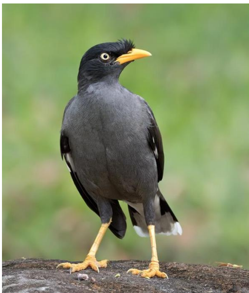
Obr. 5 Majna jávská