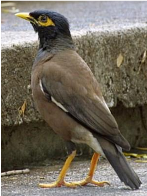
Obr. 3 Typický žlutý lem kolem oka

Popis: Poměrně robustní (25 cm, 80 - 140g) špačkovitý pták. Výrazně žlutý silný zobák a typický lem kolem oka, hlava leskle černá, tělo hnědé (na hrudi světlejší), křídla s bílým lemem v oblasti ručních krovek. Ocas svrchu hnědočerný, špičky ocasních per a spodek ocasu bílé barvy, stejně jako spodní část břicha. Nohy dlouhé a nápadně žluté. Pohlaví barevně neodlišena, samice jsou o něco menší. Poměrně hlučný druh, s variací zvuků, napodobuje i zvuky jiných druhů ptáků či lidská slova (proto v Indii chován jako analogie papoušů). Sídli v otevřené krajině, v místech introdukce zejména v sídlech a jejich okolí. Všežravec, většina potravy je hmyz, dále jiné bezobratlé, vejce a ptačí mláďata menších druhů ptáků, žáby, ryby ve vysychajících nádržích, drobné ještěrky a hlodavce. Z rostlinné stravy převládají semena a ovoce planě rostoucích i člověkem pěstovaných rostlin.