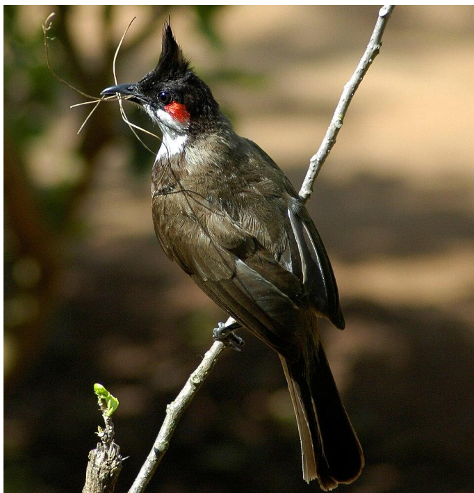
Obr 1: Bulbul červenouchý.

Původ: Původním areálem výskytu je jižní Čína, Indie a jihovýchodní Asie.