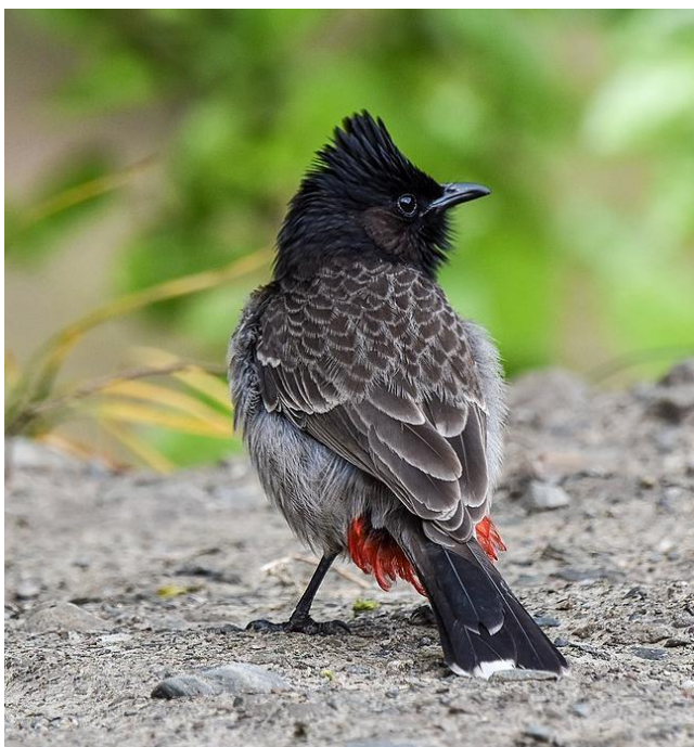
Obr 4: Bulbul šupinkový.