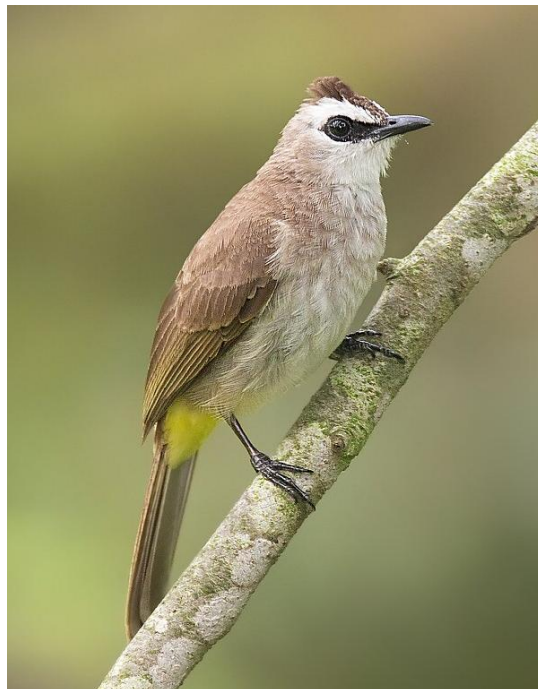
Obr 5: Bulbul žlutořítý .

Možnosti záměny: Ostatní zástupci rodu Pycnonotus mají buď hnědě, nebo žlutě zbarvené podocasní krovky. Jediný zástupce, který má také červený zadeček, je bulbul šupinkový ( Pycnonotus cafer ), který je ale větší, tmavší a na hlavě nemá špičatou chocholku a červený pruh za okem.