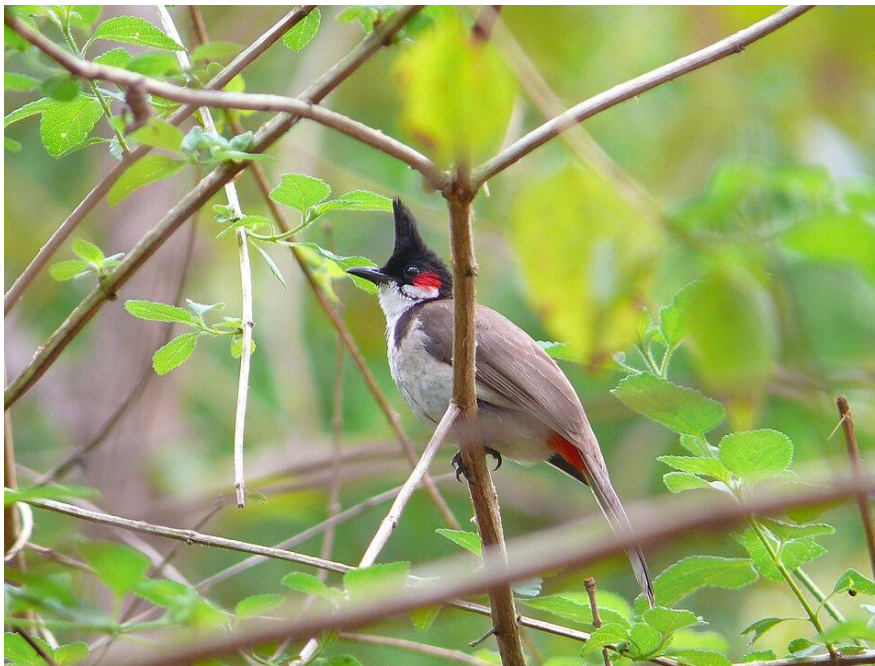
Obr 3 : Bulbul červenouchý.

Popis: Měří 17–23 cm a váží cca 20–40 g. Mezi typické znaky patří výrazná červená skvrna za okem a červené podocasní krovky. Barva těla je hnědá, břicho a krk jsou bílé. Hlava je černá, s charakteristickou špičatou chocholkou. Nohy a prsty na nich jsou obvykle krátké a tenké. Samci a samice mají podobnou barvu. Nedospělým jedincům chybí červená skvrna za okem. Bulbulové se živí ovocem a drobným hmyzem. Samice snáší 2-3 vajíčka, inkubace trvá 11-12 dní. O mláďata se starají oba rodiče cca dva týdny. Zhruba po třech týdnech jsou mláďata zcela nezávislá. Nejdelší zaznamenaná délka života dospělého jedince ve volné přírodě je 11 let. Bulbul červenouchý přirozeně obývá okraje lesů, obdělávané plochy, městské parky a zahrady. V introdukovaném areálu rozšíření se vyskytuje převážně v příměstských oblastech, parcích a zahradách. Je dobře adaptován na lesní a křovinaté biotopy. Bulbulové hnízdí v keřích, malých stromech, živých plotech a verandách budov nebo na jiných dostupných římsách či jiných místech několik metrů nad zemí. Šíří se nejen v člověkem osídlených oblastech, vysokého počtu dosahují i na odlehlých a lidmi neobydlených ostrovech.